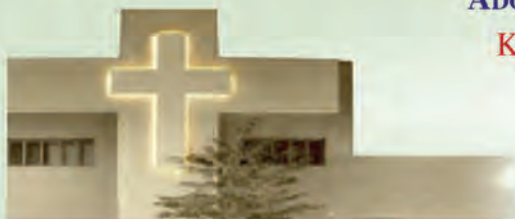
Jejuicki Ośrodek Milenijny

W pierwszy piątek miesiąca - od 17:30 do 19:30